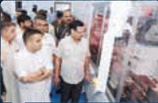
૨૮ વિકાસ દર્પણ