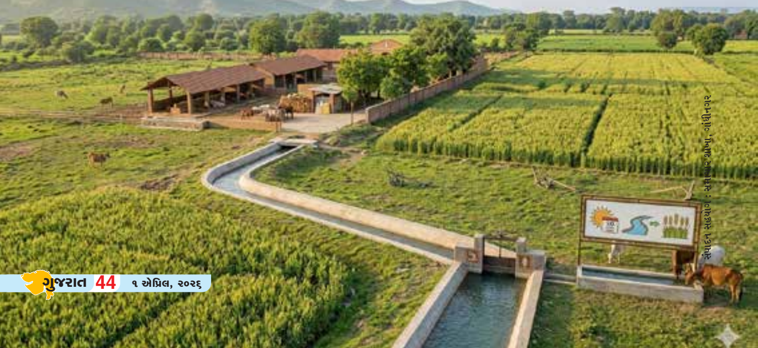
સંપાદન સહયોગ : સમીભાઈ શાખા, ગાંધીનગર

ગૌશાળા અને પાંજરાપોળ દ્વારા પશુઓની જાળવણીની જે સેવાભાવી પ્રવૃત્તિ થાય છે, તેને આર્થિક બળ પૂરું પાડવાનો રાજ્ય સરકારનો ઉદ્દેશ આ નિર્ણયથી સાચા અર્થમાં ચરિતાર્થ થયો છે. 🌊