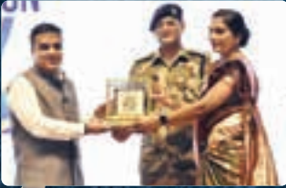
૩૬ વિકાસ ઘર્પણ