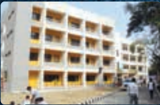
૩૭ સમાચાર વિશેષ